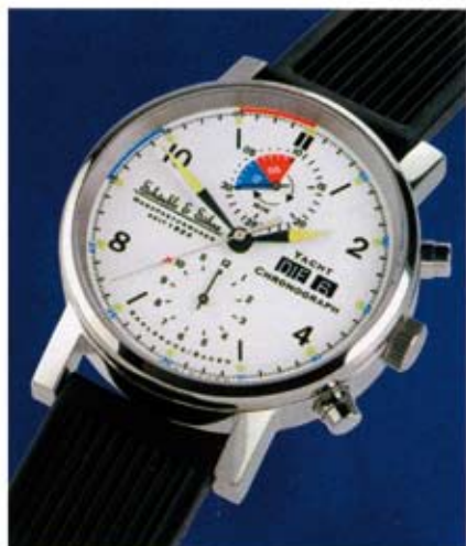
Einfacher 10-Minuten-Zähler im «Yacht-Chrono ARC 2006» von Schauble & Söhne auf einem normalen «Valjoux»-Kaliber.